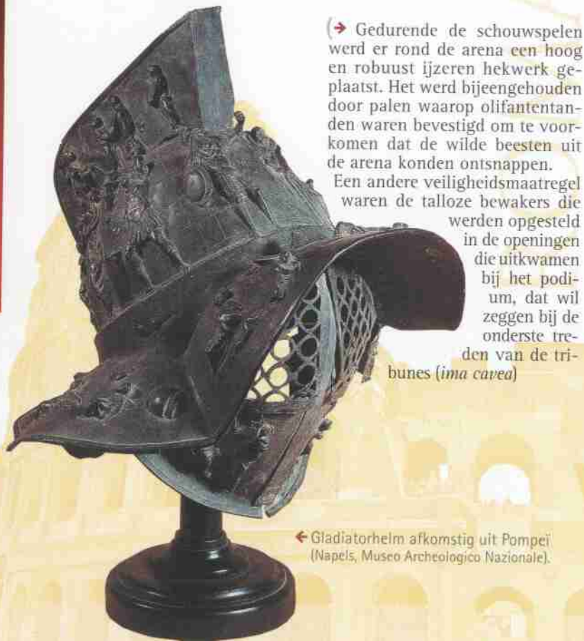
← Gladiatorhelm afkomstig uit Pompeï (Napels, Museo Archeologico Nazionale).

→ Gedurende de schouwspelen werd er rond de arena een hoog en robuust ijzeren hekwerk geplaatst. Het werd bijeengehouden door palen waarop olifantentanden waren bevestigd om te voorkomen dat de wilde beesten uit de arena konden ontsnappen.